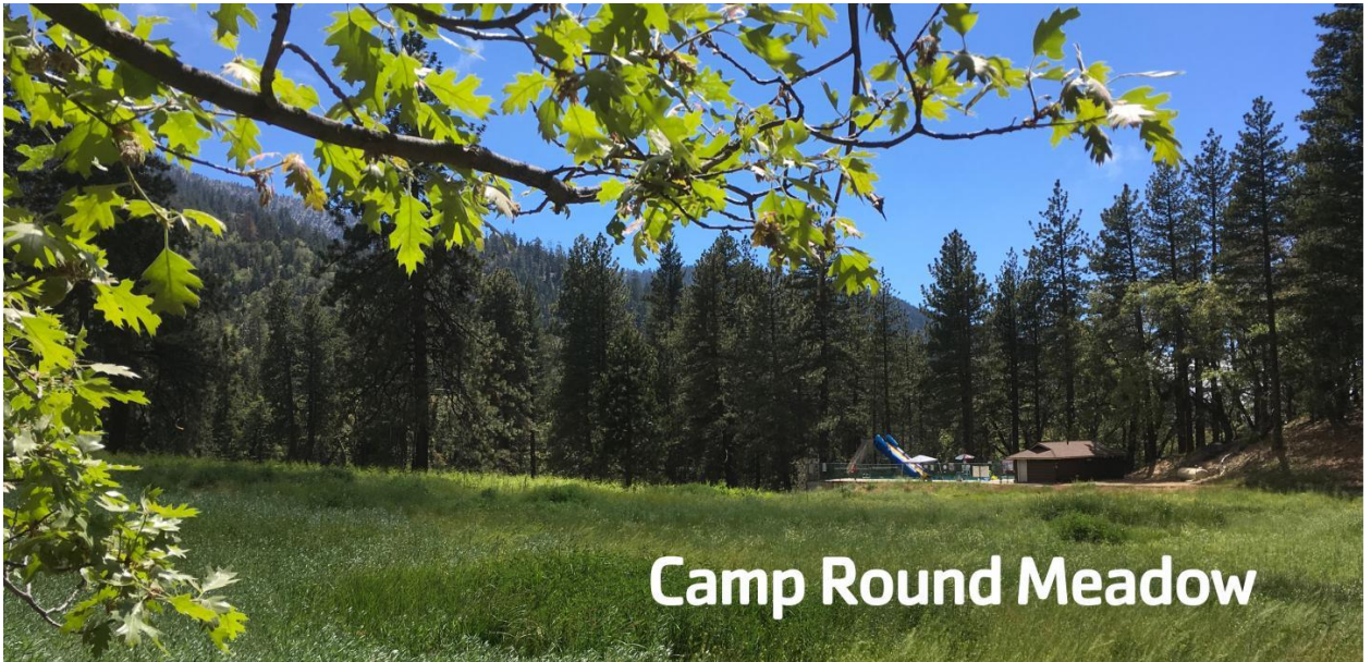
Camp Round Meadow